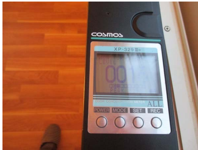
X P - 329 III ( 1 / 10 億 ) による臭気指数 17 ( 22 から減少 )