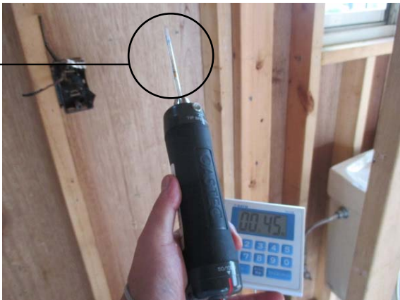
ホルムアルデヒド検知管による測定 : ホルムアルデヒドは検知されず