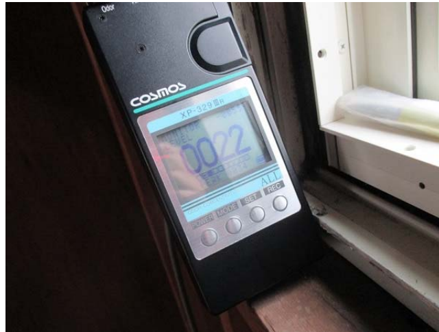
X P - 329 III ( 1 / 10 億 ) による臭気指数 22