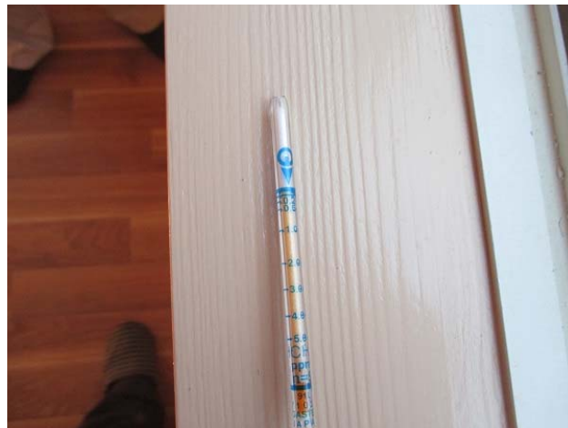
ホルムアルデヒド検知管による測定 : ホルムアルデヒドは検知されず